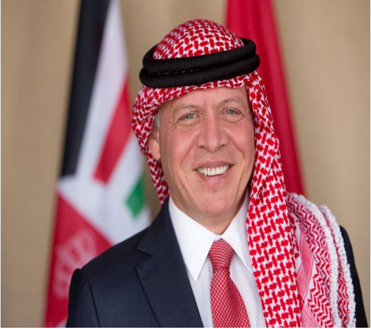
صاحب الجلالة الملك عبدالله الثاني بن الحسين المعظم