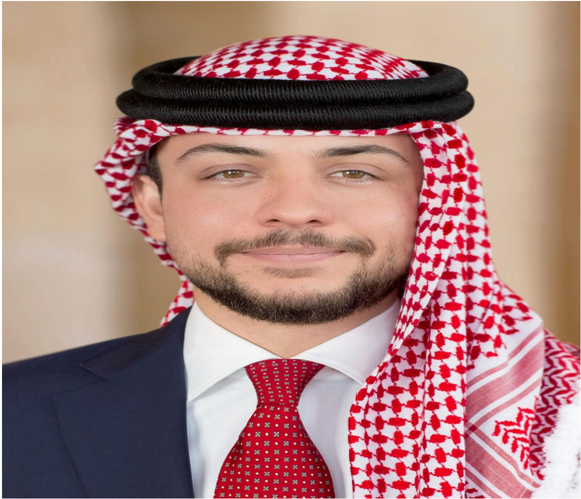
صاحب السمو الملكي الأمير الحسين بن عبدالله المعظم